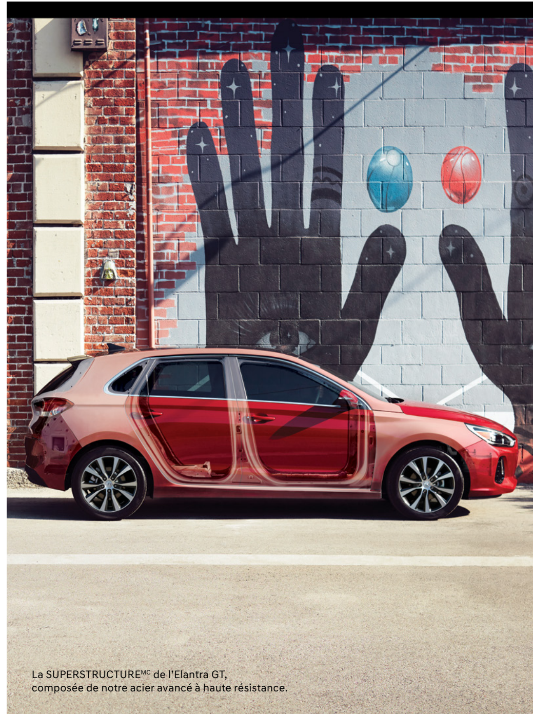
La SUPERSTRUCTURE MC de l'Elantra GT, composée de notre acier avancé à haute résistance.

Nous mettons nos véhicules à l'épreuve dans les environnements les plus éprouvants, par exemple dans l'Arctique, dans le désert de Mojave et sur le fameux Nürburgring, ce légendaire circuit automobile situé en Allemagne. Enfin, nous dotons nos véhicules de caractéristiques de sécurité et de technologies avancées, en plus de les protéger avec l'une des meilleures garanties de l'industrie. Bref, nous offrons un rapport qualité-prix vraiment exceptionnel.