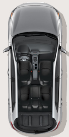
705 litres d'espace utilitaire avec les dossiers arrière redressés

Grâce à la grande capacité de l'espace utilitaire de l'Elantra GT, vous pourrez charger votre équipement en toute tranquillité d'esprit. Généreux, l'espace intérieur peut être facilement adapté à vos besoins grâce aux dossiers des sièges arrière rabattables divisés 60/40, de manière à transporter à la fois des objets longs et un passager à l'arrière.