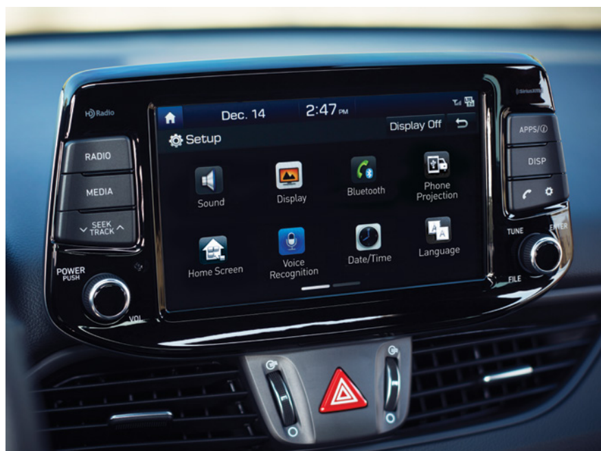
Écran tactile de 8 pouces de série avec Apple CarPlay MCA et Android Auto MCA