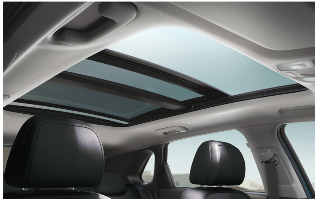
Toit ouvrant panoramique livrable

À l'avant, l'écran tactile de 8 pouces de série est parfaitement positionné pour le conducteur et le passager avant. En plus de vous donner accès à la caméra de recul et au système de téléphonie mains libres Bluetooth®, cet écran tactile vous permet d'interagir intuitivement avec vos applications préférées, grâce à la connectivité Apple CarPlay MCA et Android Auto MCQ pour téléphone intelligent.