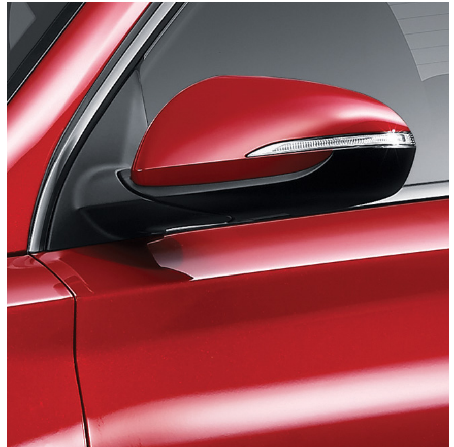
Clignotants à DEL aux rétroviseurs de série