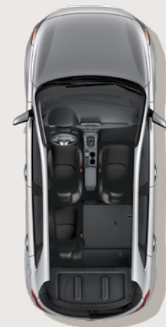
Sièges arrière rabattables divisés 60/40