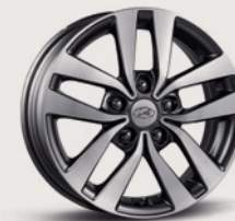
Jantes de 16 po en alliage