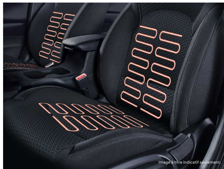
Sièges avant chauffants de série