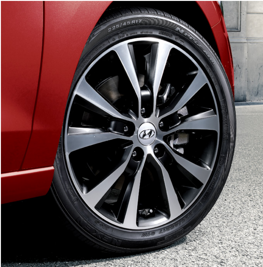
Jantes de 17 po en alliage livrables

Des surfaces sculptées avec précision, une silhouette effilée et des éléments de design expressifs confèrent à l'Elantra GT un raffinement épuré. Ses passages de roues athlétiques évoquent son impatience à dévorer les routes les plus sinueuses. Avec cette voiture, vous chercherez les moyens d'allonger le chemin du retour à la maison, particulièrement avec le toit ouvrant panoramique livrable, qui fait entrer la lumière naturelle à profusion.