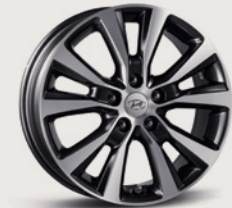
Jantes de 17 po en alliage