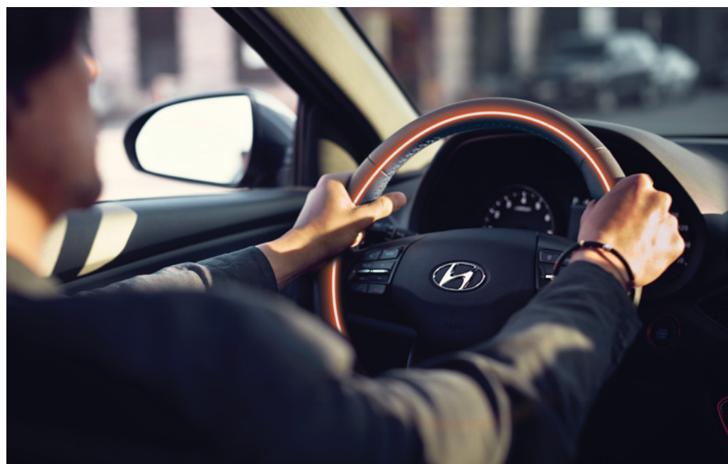
Volant chauffant gainé de cuir de série