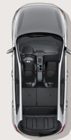
1 560 litres d'espace utilitaire avec les dossiers arrière rabattus