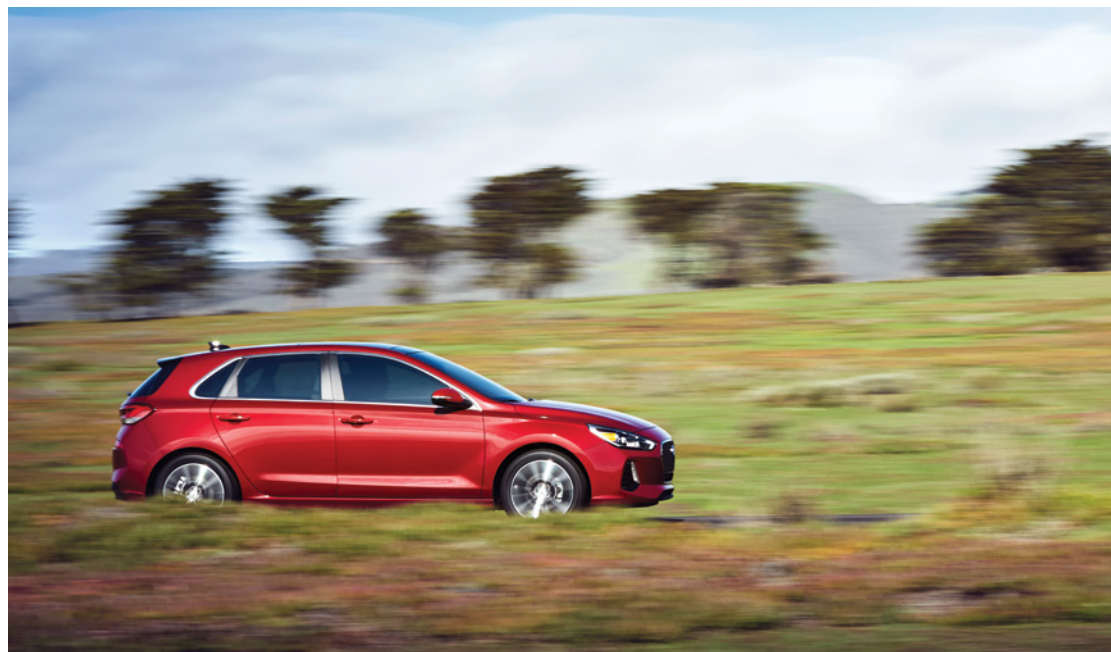
Moteur de 2,0 L à injection directe d'essence de série : 161 chevaux, 150 lb-pi de couple

L'Elantra GT a été conçue pour offrir une expérience de conduite amusante et sportive. Avec son moteur de 2 litres à injection directe d'essence, l'Elantra GT est en mesure de contrôler avec précision son alimentation en carburant, pour une puissance accrue et un meilleur rendement énergétique. Dispositif novateur, le sélecteur de mode de conduite rehausse votre conduite en ajustant les réactions du moteur et de la direction en fonction de vos préférences.