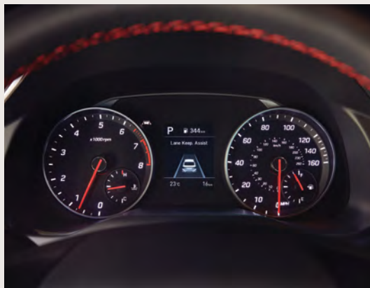
Instrumentation sport de série