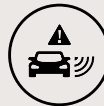
Alerte de collision dans l'angle mort