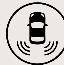
Alerte de collision transversale arrière