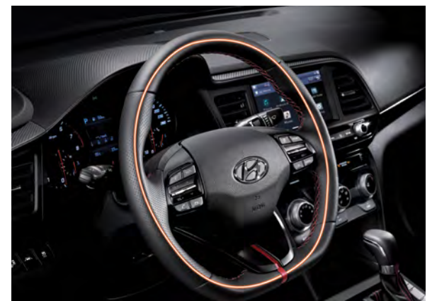
Volant chauffant en forme de « D » de série