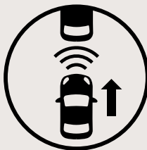
Assistance à l'évitement de collision frontale

Entourez-vous des dispositifs de sécurité Hyundai SmartSense MC . Ces technologies de pointe sont conçues pour vous aviser des dangers imprévus et vous aider à les éviter.