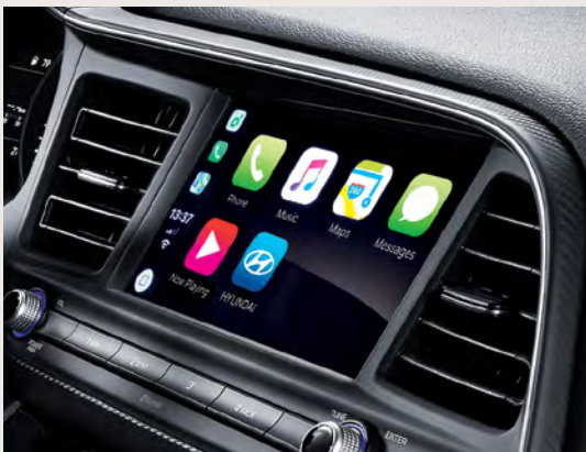
Écran tactile de 7 pouces avec Apple CarPlay MCΔ et Android Auto MC○ de série

Vous cherchez des fonctionnalités pour vous aider à rester connecté? La connectivité Apple CarPlay MCΔ et Android Auto MC○ de série vous permet d'utiliser facilement vos applications préférées (navigation, musique et plus encore) à l'aide de l'écran tactile intuitif de 7 pouces.