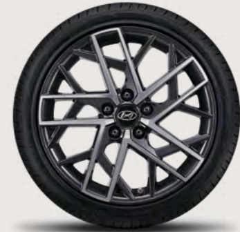
Jante de 18 po en alliage de série