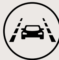
Alerte de franchissement de voie avec assistance au maintien de voie