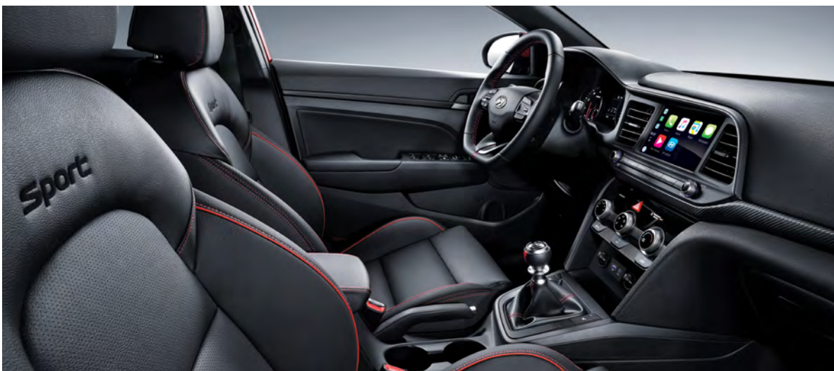
Sièges sport en cuir avec coutures rouges

Installez-vous confortablement dans le siège en cuir doté de volumineux renforts latéraux et agrippez fermement le volant sport en forme de « D » pour prendre le contrôle. Les sièges avant et le volant sont chauffants, pour un confort accru par temps froid. Inspirées du sport automobile, des garnitures noires uniques ornent le tableau de bord, le pavillon et le levier de boîte, tandis que des éléments rouges contrastants viennent compléter le design distinctif de l'habitacle.