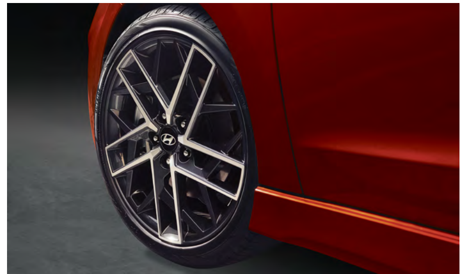
Jantes de 18 po en alliage de série