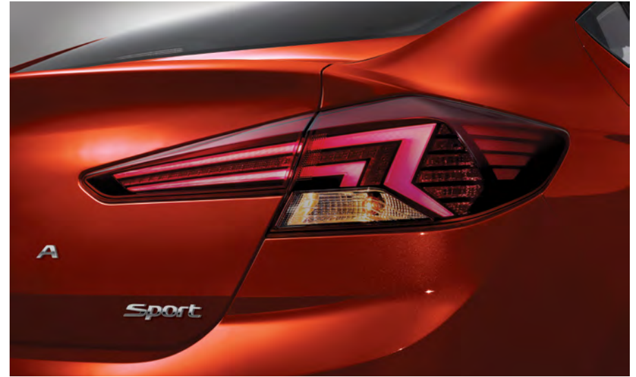
Feux arrière à DEL de série