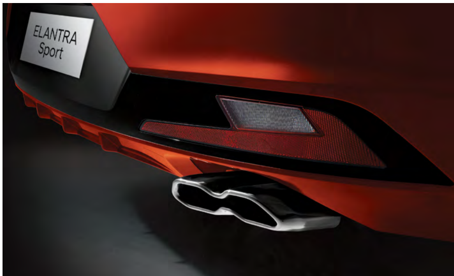
Échappement à double embout chromé de série