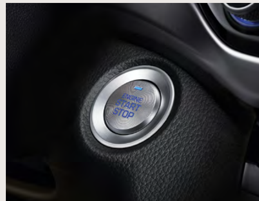
Télédéverrouillage à capteur de proximité avec démarrage à bouton-poussoir de série