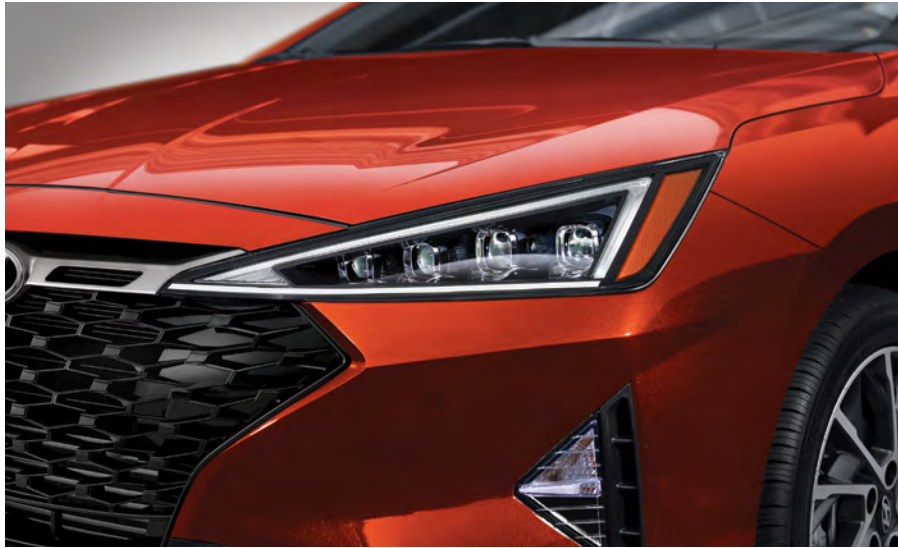
Phares à DEL de série

La conception unique du bouclier avant donne le ton avec des lignes de carrosserie acérées qui encadrent une calandre noire et chromée au style caractéristique. À l'arrière, l'échappement à double embout chromé et le diffuseur s'intègrent parfaitement au pare-choc.