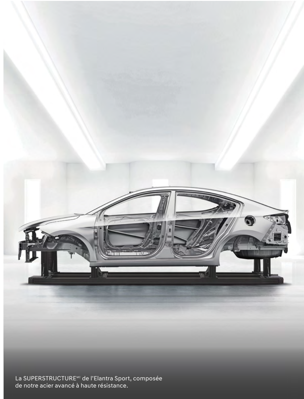
La SUPERSTRUCTURE MC de l'Elantra Sport, composée de notre acier avancé à haute résistance.

Nous mettons nos véhicules à l'épreuve dans les environnements les plus éprouvants, par exemple dans l'Arctique, dans le désert de Mojave et sur le fameux Nürburgring, ce légendaire circuit automobile situé en Allemagne. Enfin, nous dotons nos véhicules de caractéristiques de sécurité et de technologies avancées, en plus de les protéger avec l'une des meilleures garanties de l'industrie. Bref, nous offrons un rapport qualité-prix vraiment exceptionnel.