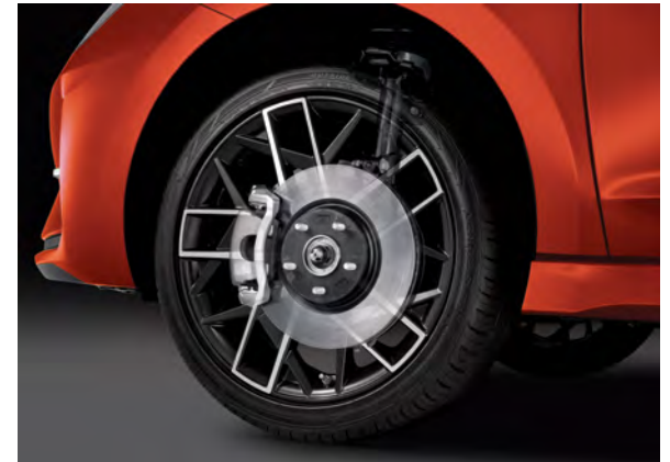
Freins à disque aux 4 roues de série