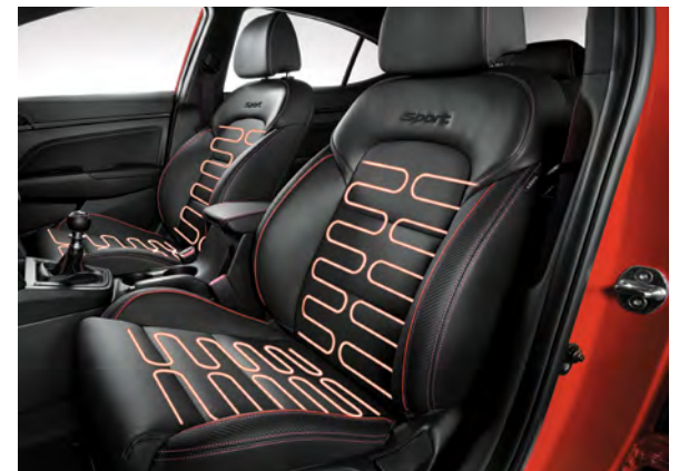
Sièges avant chauffants de série