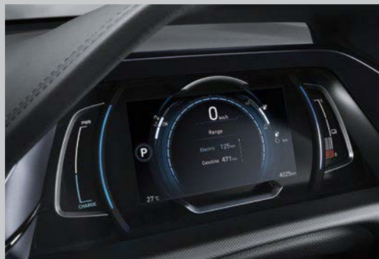
Écran de supervision couleur ACL de 7 po livrable