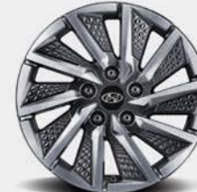
Jantes de 16 po en alliage de type Eco De série sur les modèles électriques Preferred et Ultimate