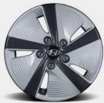
Jantes de 15 po en alliage de type Eco (avec enjoliveurs aérodynamiques) De série sur le modèle hybride Essential