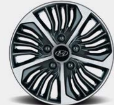
Jantes de 16 po en alliage de type Eco De série sur les modèles rechargeables Preferred et Ultimate