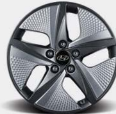
Jantes de 17 po en alliage de type Eco De série sur le modèle hybride Ultimate