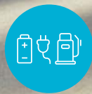
IONIQ hybride rechargeable