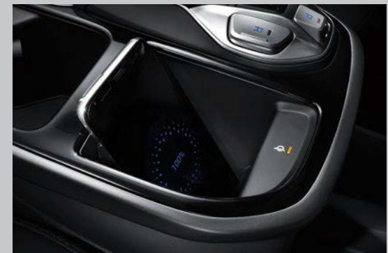
Chargeur sans fil V livrable