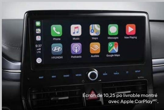
Écran de 10,25 po livrable montré avec Apple CarPlay MC .

L'écran tactile de 8 po de série ou l'écran tactile de 10,25 po livrable sont les centres névralgiques de la connectivité pour accéder de manière intuitive à vos applis préférées de votre téléphone intelligent avec Apple CarPlay MCA et Android Auto MCO de série. Parcourez vos chansons et écoutez votre liste de lecture préférée avec la qualité sonore remarquable du nouveau système audio de luxe harman/kardon® à 8 haut-parleurs et de la technologie de restauration musicale Clari-Fi MC afin que le son de vos fichiers audio compressés soit plus clair et net. De plus, lorsque la batterie de votre téléphone intelligent s'affaiblit, posez-le simplement sur le chargeur sans fil V livrable, sans câble de connexion.