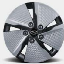
Jantes de 15 po en alliage de type Eco (avec enjoliveurs aérodynamiques) De série sur le modèle hybride Preferred