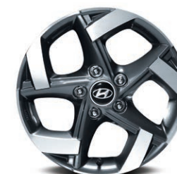
Jantes de 17 po en alliage

Offertes de série sur le modèle Preferred