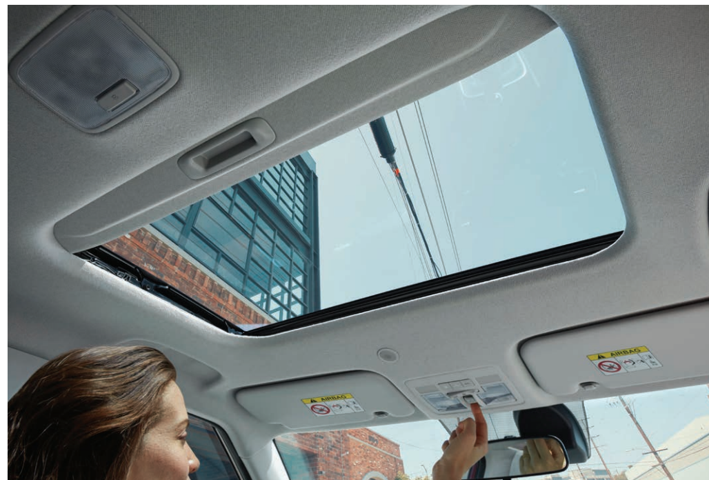
Toit ouvrant électrique livrable

La connectivité Apple CarPlay MCA et Android Auto MC0 offerte de série vous permet d'accéder à vos applications mobiles préférées — musique, cartes, messages, etc. — de manière harmonieuse et en toute sécurité, via des commandes vocales et l'écran tactile. Une nouveauté pour 2021 : les modèles Essential, Preferred et Trend disposent d'une pratique connexion sans fil, aucun câble requis.