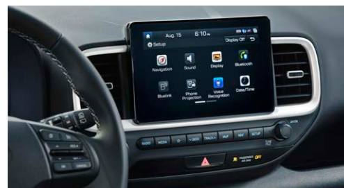
Sièges avant chauffants offerts de série Écran tactile de 8 po offert de série