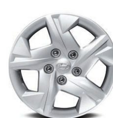
Jantes de 15 po en acier

Offertes de série sur le modèle Essential