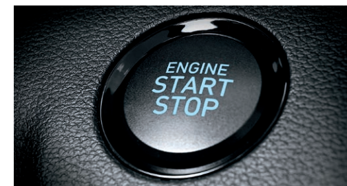
Volant chauffant livrable Clé à capteur de proximité avec démarrage à distance et bouton-poussoir livrable