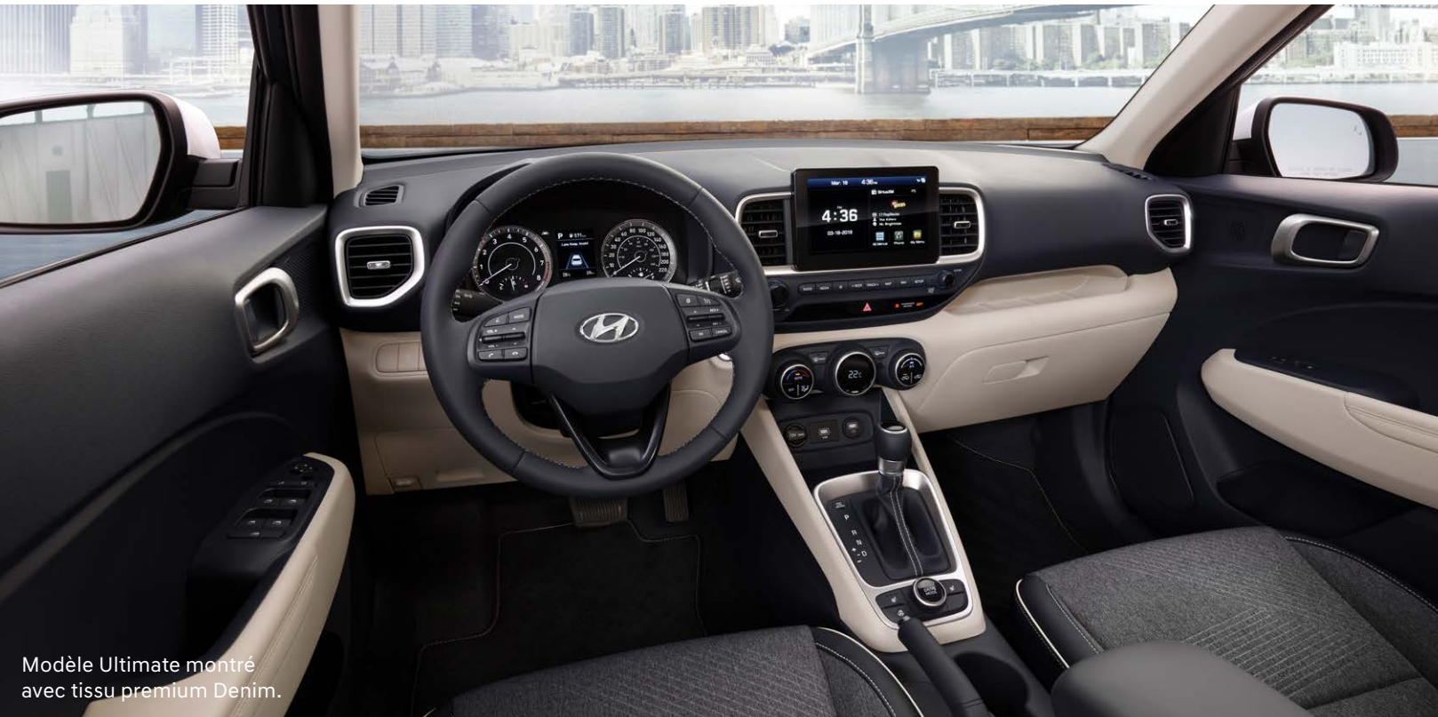
Modèle Ultimate montré avec tissu premium Denim.

Le Venue offre un espace des plus polyvalents pouvant s'adapter à tous vos besoins. Une tablette arrière des plus pratiques vous permet de sous-diviser facilement votre espace de rangement; elle se range d'ailleurs aisément lorsqu'elle n'est pas utilisée, maximisant votre espace de chargement. Les sièges arrière rabattables divisés 60/40 facilitent également le transport de longs objets.