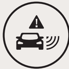
Détecteur d'objet dans l'angle mort