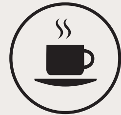
Alerte de baisse d'attention du conducteur