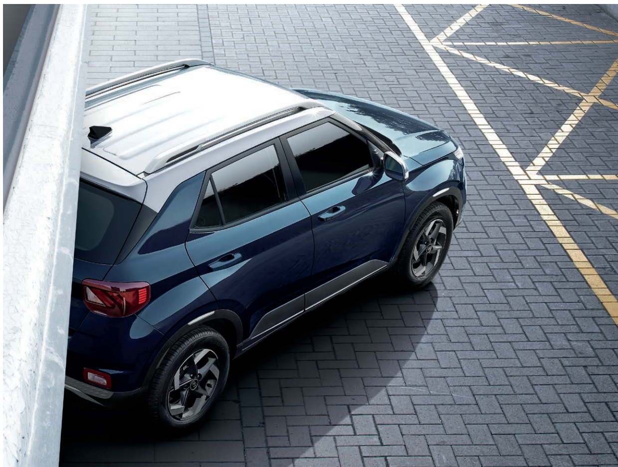
Revêtement bicolore livrable

Le Venue fera assurément tourner les têtes grâce à ses lignes modernes et à son design audacieux. Qui plus est, vous serez libre d'exprimer votre personnalité grâce à un choix de couleurs vibrantes, et vous aurez l'option d'ajouter des accents bicolores sur certains modèles sélectionnés. Ses phares enveloppants avant distinctifs se fondent en une ligne latérale de relief qui se prolonge jusqu'aux feux arrière, sans oublier ses jantes de 17 pouces en alliage livrables dotées d'un motif de rayonnage tout à fait remarquable.