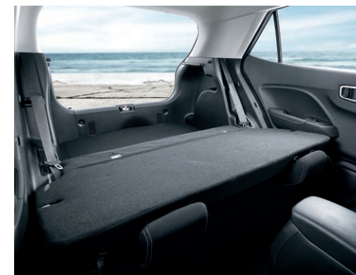
Sièges arrière rabattables 60/40 de série Capacité de chargement de 902 L de série (lorsque les sièges sont rabattus)