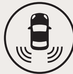
Alerte de collision transversale arrière