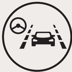
Alerte de franchissement de voie avec assistance au maintien de voie