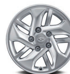
Jantes de 15 po en alliage

Offertes de série sur le modèle Essential