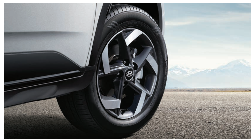
Phares à DEL livrables Jantes de 17 po en alliage livrables