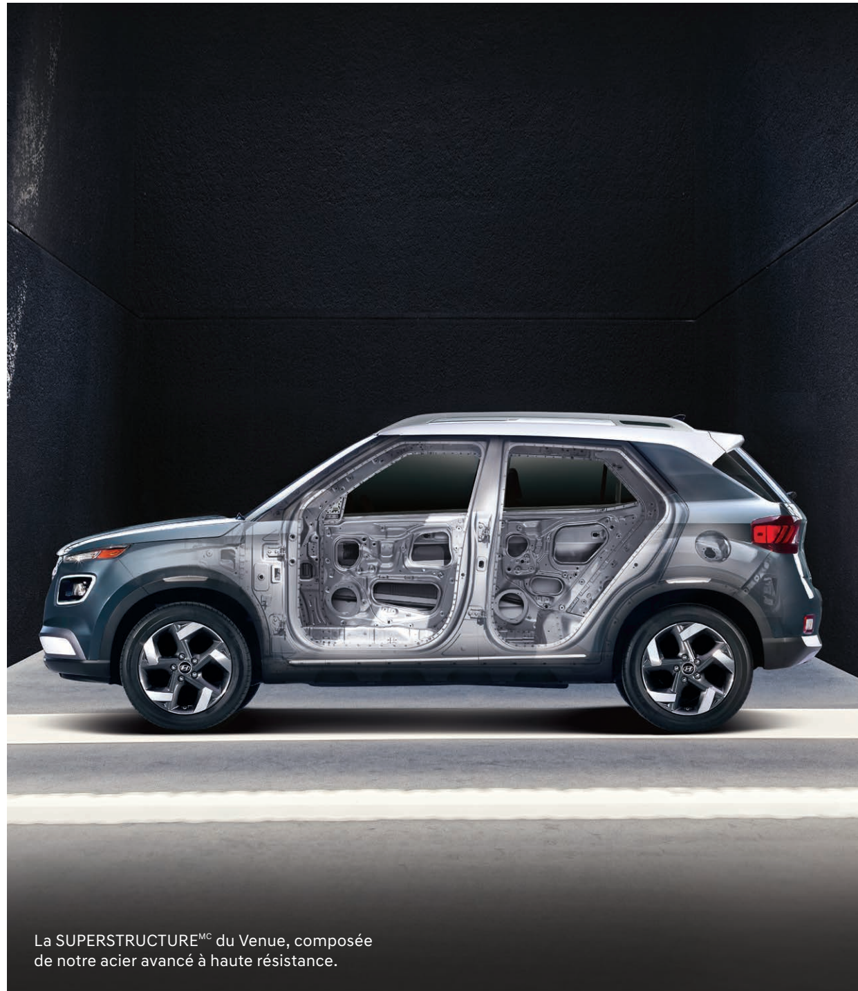
La SUPERSTRUCTURE MC du Venue, composée de notre acier avancé à haute résistance.

Nous mettons nos véhicules à l'épreuve dans les environnements les plus éprouvants, par exemple dans l'Arctique, dans le désert de Mojave et sur le fameux Nürburgring, ce légendaire circuit automobile situé en Allemagne. Enfin, nous dotons nos véhicules de caractéristiques de sécurité et de technologies avancées, en plus de les protéger avec l'une des meilleures garanties de l'industrie. Bref, nous offrons un rapport qualité-prix vraiment exceptionnel.