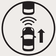
Assistance à l'évitement de collision frontale avec détection des piétons