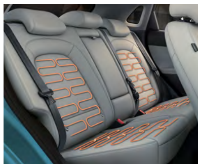
Sièges arrière chauffants livrables