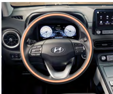
Volant chauffant gainé de cuir de série