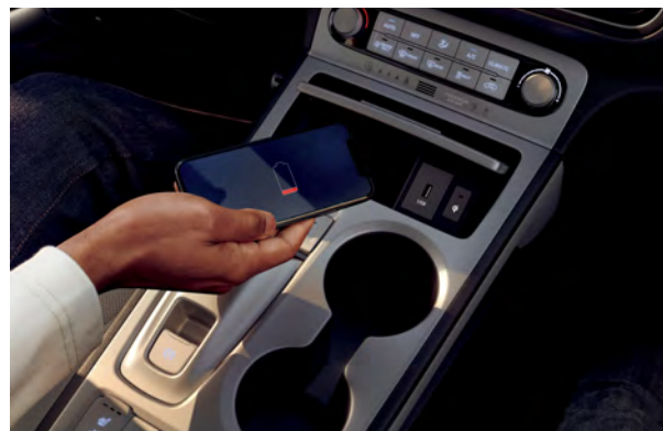
Chargeur sans fil livrable▼