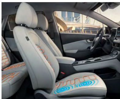
Sièges avant chauffants de série Sièges avant ventilés livrables