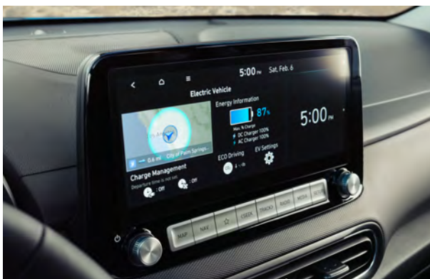
Écran tactile de 10,25 po avec système de navigation livrable