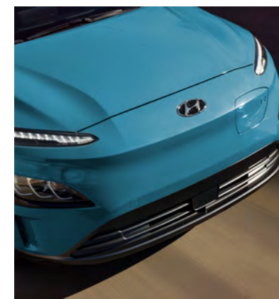
Pare-chocs avant redessiné