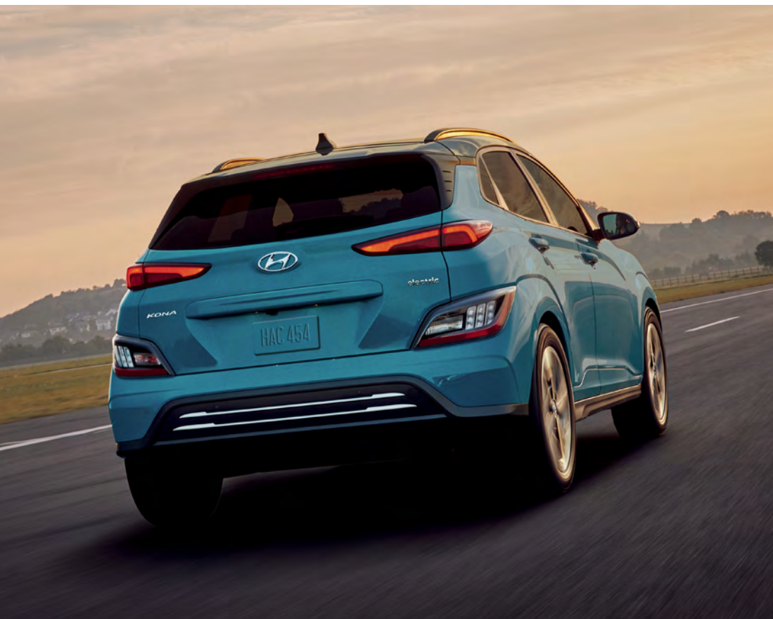
Pare-chocs arrière redessiné

Avec son nouveau design avant et arrière saisissant, la beauté du KONA électrique ne se limite pas qu'à son rendement. De nouvelles moulures de passage de roue de la couleur de la carrosserie encadrent les jantes expressives en alliage de 17 pouces, tandis que le choix audacieux de couleurs de peinture extérieure ajoute du caractère au véhicule.