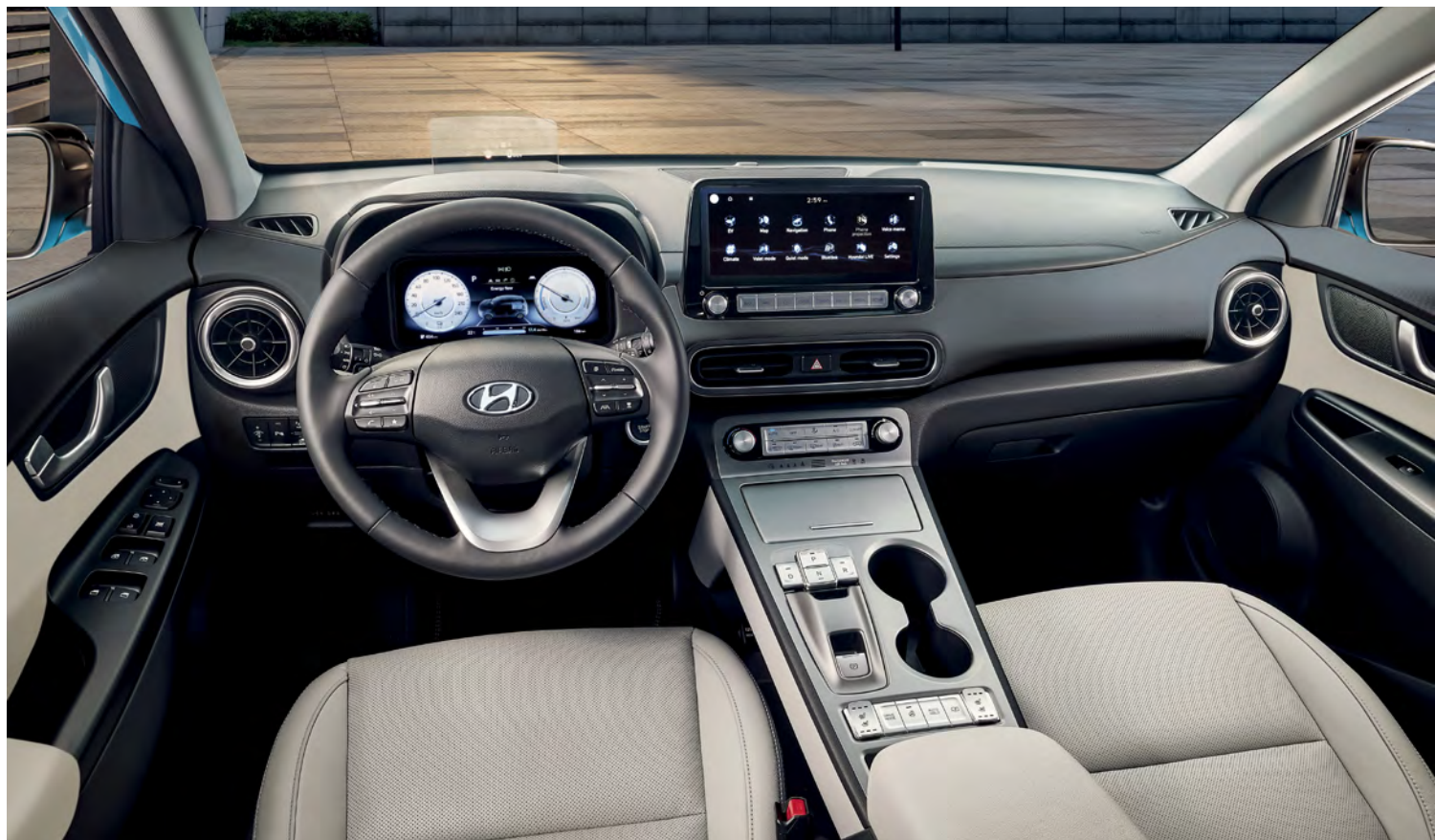
Modèle Ultimate montré.

Entourez-vous de confort tout l'hiver grâce aux sièges avant chauffants et au volant chauffant de série. Et lorsque la température extérieure grimpe, le KONA électrique vous garde au frais avec ses sièges avant ventilés livrables et son toit ouvrant électrique livrable qui laisse entrer une brise rafraîchissante.