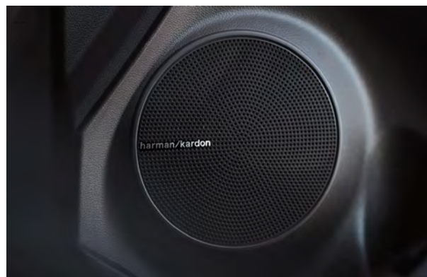
Chaine audio harman/kardon MD haut de gamme livrable