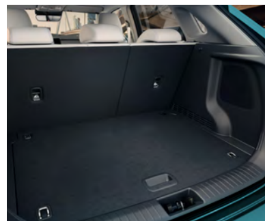
Capacité de chargement pouvant atteindre 1296 litres lorsque les sièges arrière sont rabattus.