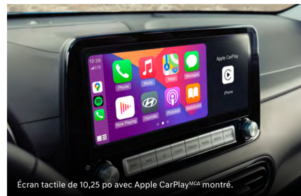
Écran tactile de 10,25 po avec Apple CarPlay MCA montré.