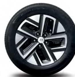
Jantes en alliage de 17 po