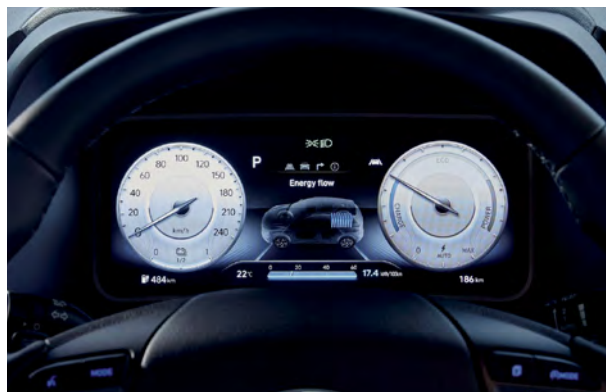
Panneau d'instrumentation entièrement numérique de 10,25 po de série

Suivez en temps réel l'état de charge de la batterie, l'autonomie restante et le flux d'énergie entre les composants du groupe motopropulseur à partir de l'écran tactile. Lorsque le véhicule est équipé du système de navigation livrable, vous pouvez également calculer votre autonomie pour trouver des bornes de recharge.