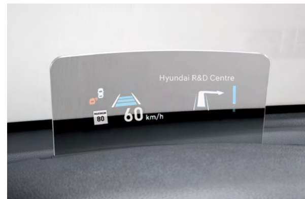
Affichage tête haute livrable