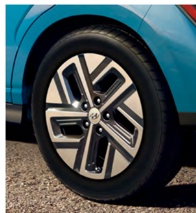
Jantes en alliage de 17 po de série