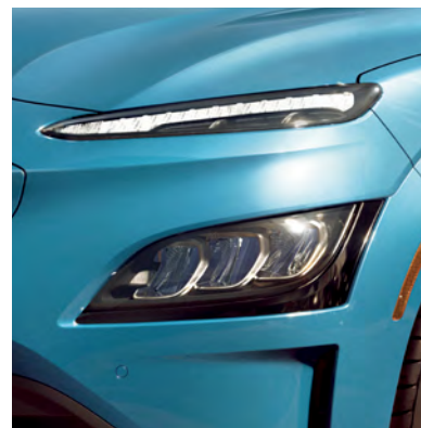
Phares à DEL livrables