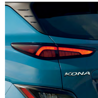
Feux arrière à DEL de série