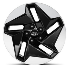
Jantes en alliage de 17 po aérodynamiques