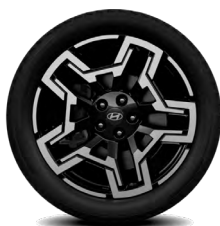
Jantes en alliage de 20 po Livable avec la version Ultimate