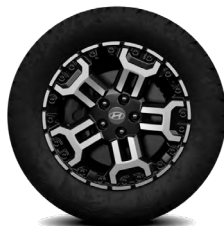
Jantes XRT en alliage de 18 po Avec la version XRT exclusivement