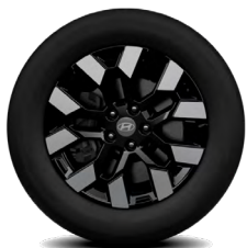
Jantes en alliage de 18 po De série avec la version Preferred