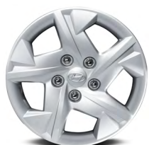
Jantes en acier de 15 po De série avec la version Essential