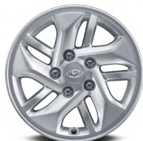
Jantes en alliage de 15 po De série avec la version Preferred