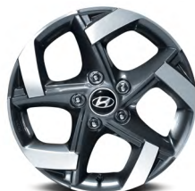
Jantes en alliage de 17 po De série avec la version Ultimate